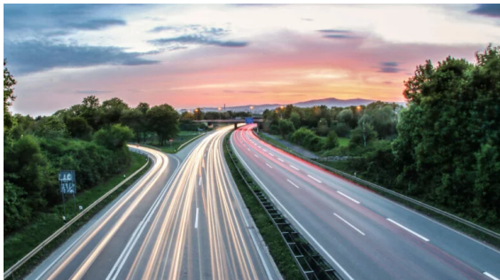
Obr. 2: Přísady pro asfaltové směsi

Využití je mnoho. Více se dozvíte na: www.ciur.cz