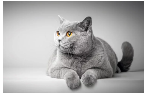
Obr. 3: Ekologická steliva

Jak se bude Český badmintonový svaz na spolupráci podílet? Sběrem badmintonových tub.