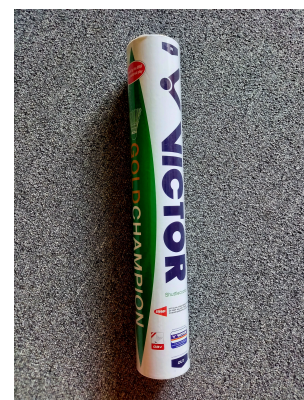
Obr. 4: Badmintonová tuba